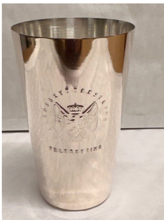
Post 1.04-1.06 Standardbeger felt Tilsvarende begertype post 1.12, men påsetting av DFS-logo i farger