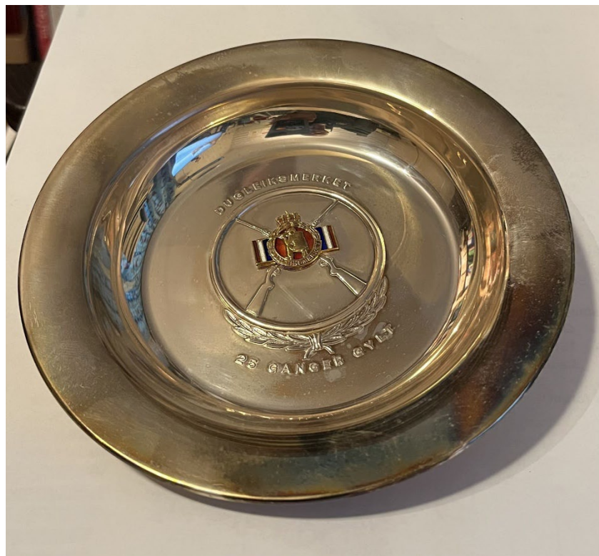
Post 1.42 Dugleiksmærke fat