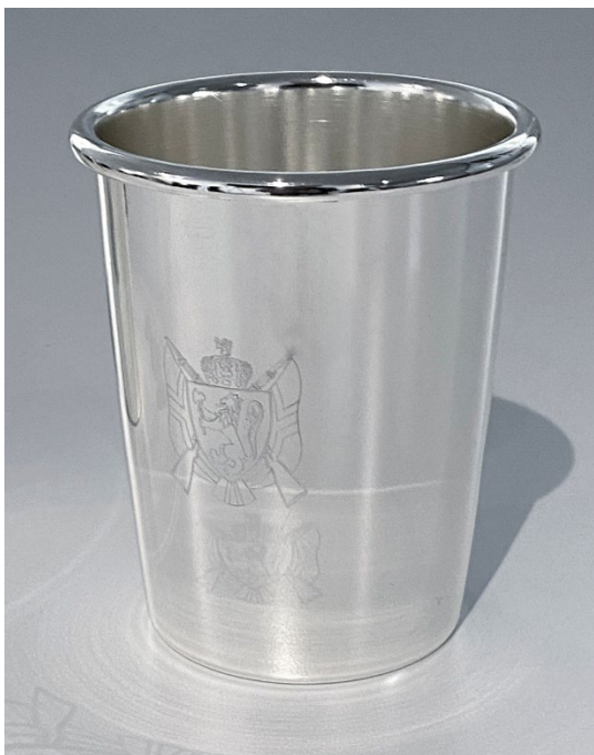
Post 1.16 a) Alternativt mesterskapsbeger