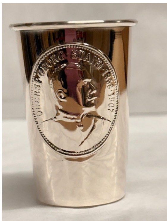
Post 1.07 Standardbeger Stangskyting