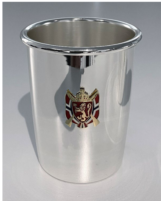
Post 1.16 b) Alternativt mesterskapsbeger