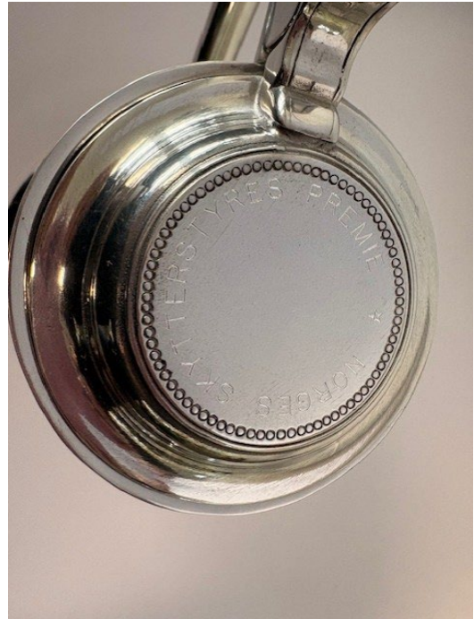
Post 1.22 b) Utforming lokk med graving