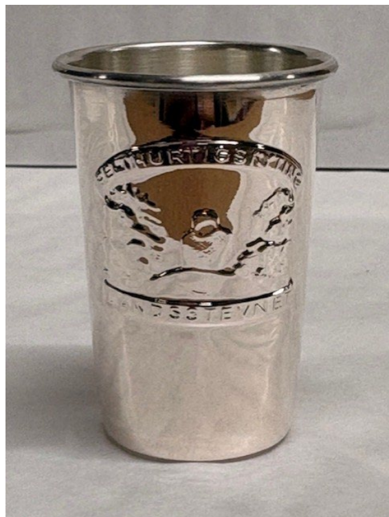
Post 1.08 Felthurtigskyting