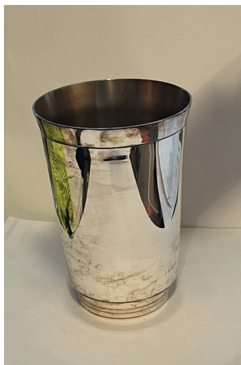
Post 1.40 LDKS pokal til U22