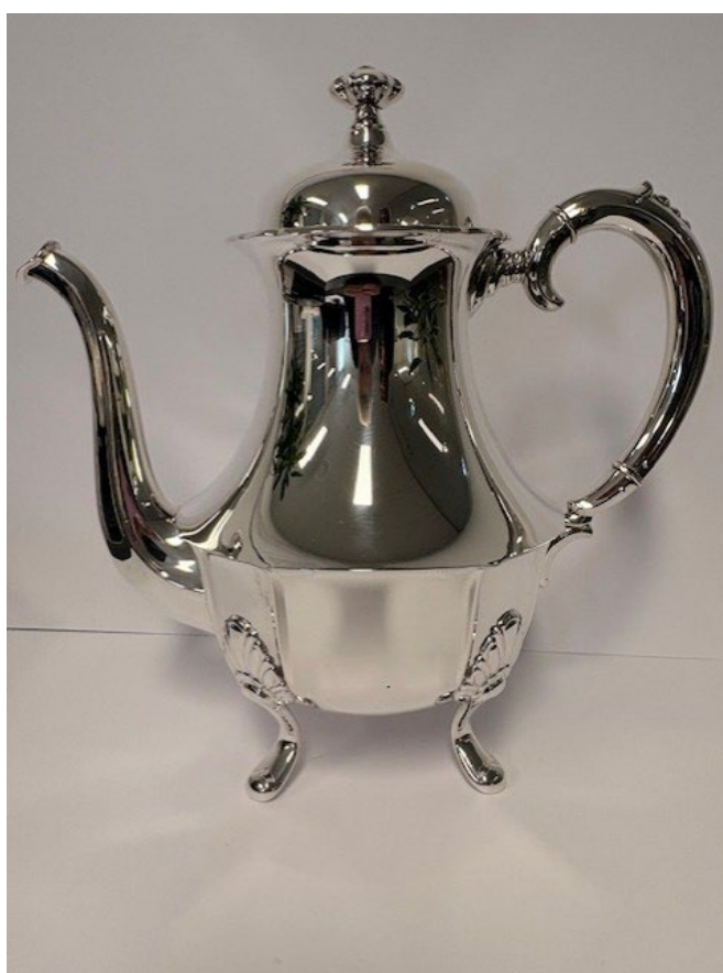
Post 1.17 og 1.18 Tekanne