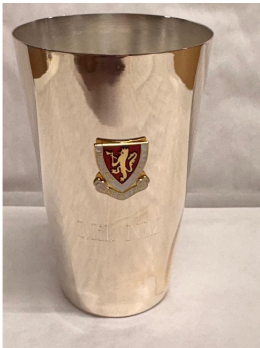
Post 1.26-1.31 Standardbeger bane og felt til Militært NM. Samme utforming som sivile beger, men med påsatt logo på bakside og graving Mil. NM