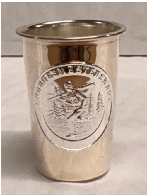
Post 1.35 Standardbeger skogsløp