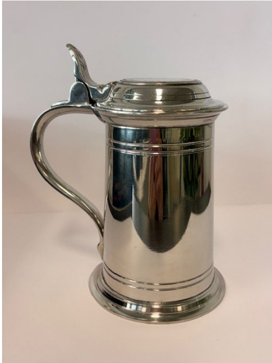
Post 1.22 Krus med lokk