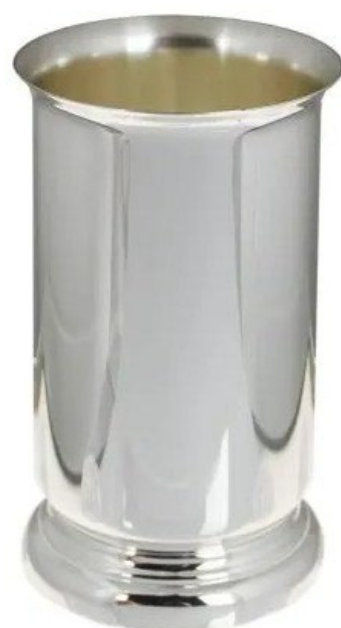
Post 1.38-1.39 Landsdelskrets pokal