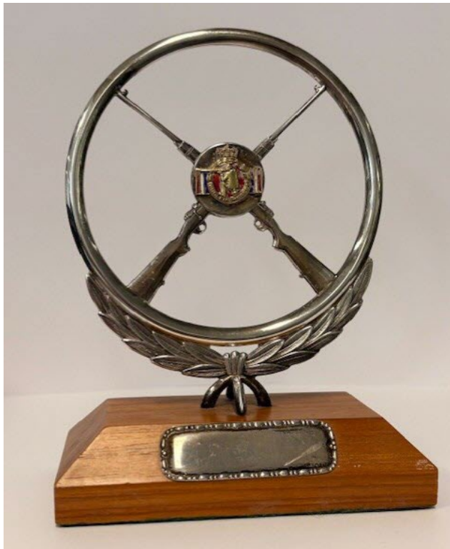
Post 1.41 Dugleiksmærke statuett framside