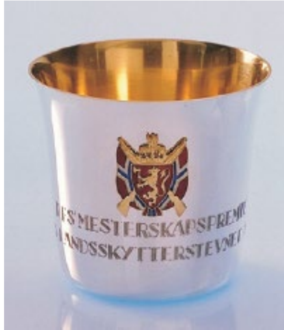
Post 1.15 og 1.16 DFS mesterskapsbeger Om lag denne forma, men ikkje forgylt innvendig