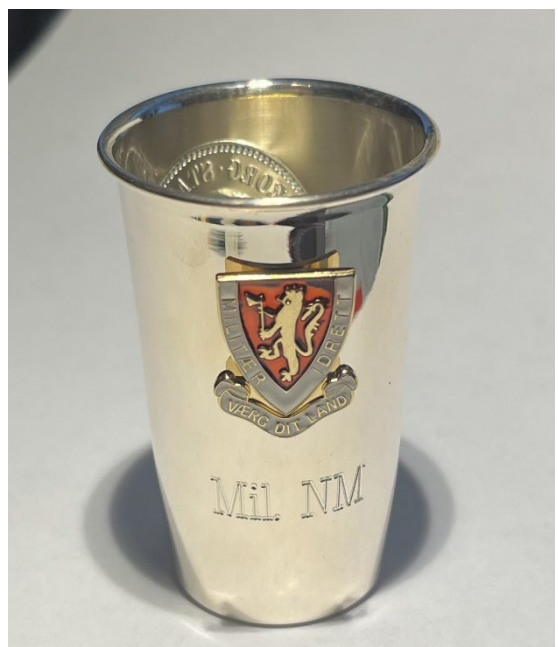
Post 1.32 og 1.33 Beger Stang og Felthurtig til Militært NM Samme utforming som sivile beger, men med påsatt logo på bakside og graving Mil. NM