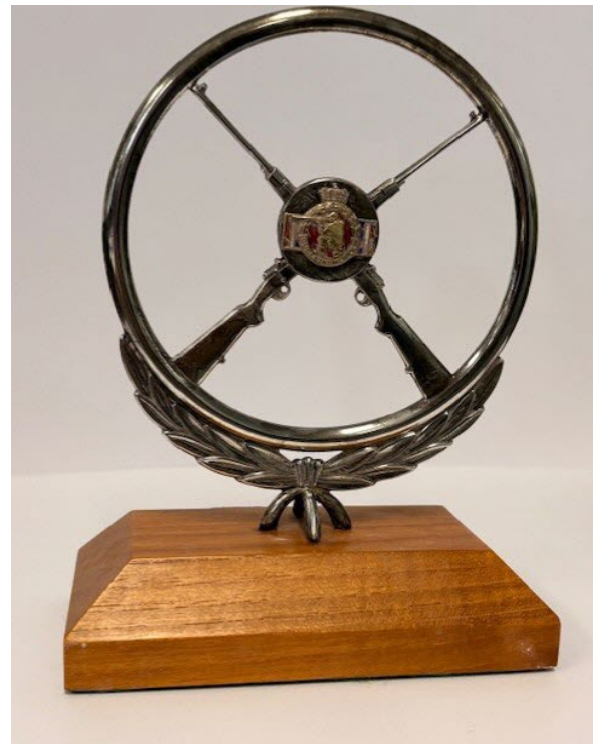
Post 1.41 Dugleiksmærke statuett bakside